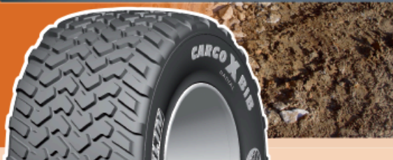
Pression en bar / psi – Charges par pneu en kg (4)