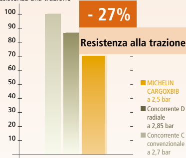
Indice di resistenza alla trazione

Dimensioni: 600/55 R26.5 (600/55 - 26.5 per il concorrente C) Condizioni: 6500 kg a 8 km/h