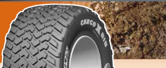
Pressione (bar) e (psi) - Carico per pneumatico in kg (4)