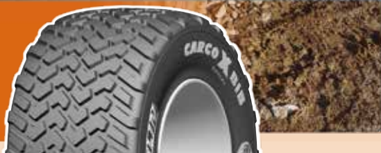
Pressione (bar) e (psi) - Carico per pneumatico in kg (4)