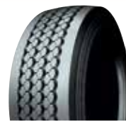
PLTE3 / RCL TE3