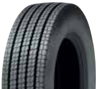
PLZU 3 / RCL ZU3