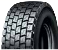
PLDE2 / RCL DE2+