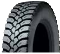
PLDY4 / RCL DY4