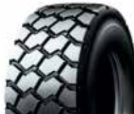
RCL ZH 445/65 R 22.5