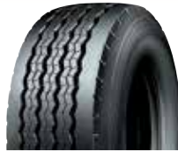
PLTE2 / RCL TE2