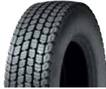
PLDA+N / RCL DA4S