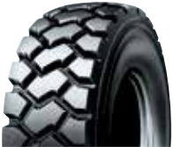
PLZH / RCL ZH