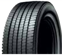
PLDA2 / RCL DA2