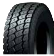
PLZY3 / RCL ZY3