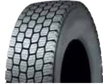
PLDE MW3D / RCL DE MW3D