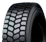
PLDS / RCL DS