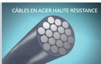
CÂBLES EN ACIER HAUTE RÉSISTANCE

• Un fil d'acier continu ceinturant le pneu pour augmenter sa stabilité. L'empreinte au sol est ainsi optimisée tout au long de la durée de vie du pneumatique. La résistance moindre au roulement permet d'augmenter la longévité et de réduire la consommation de carburant. Augmente l'indice de charge (IC) et la sécurité, y compris dans des conditions d'utilisation difficiles.