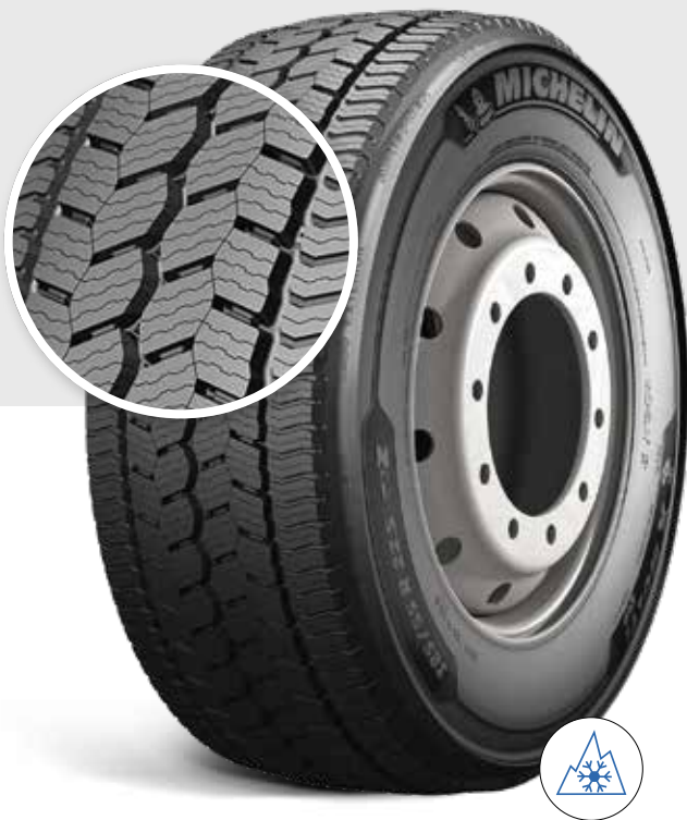
MICHELIN X ® MULTI ™ GRIP Z 385/65 R 22.5