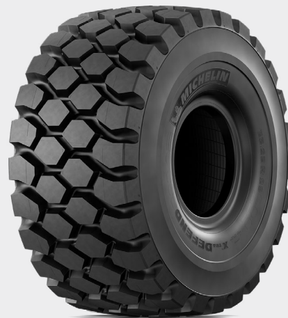
MICHELIN XTRA DEFEND SÉRIE 65