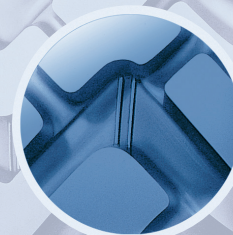
Point de prise d'usure

RÉPARABILITÉ ET RECHAPABILITÉ MAXIMISÉES GRÂCE À L'EXTRÊME FIABILITÉ DE LA CARCASSE (##)