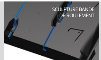
SCULPTURE BANDE DE ROULEMENT