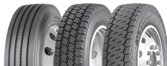
Agilis HD Z

Un bon entretien a des répercussions sur la durée de vie et les performances des pneus Veuillez-vous assurer que la pression d'air recommandée soit maintenue et que les rotations soient effectuées aux intervalles appropriés