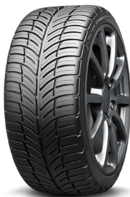
g-FORCE™ COMP-2™ A/S PLUS

BFGoodrich Advantage Control は、特徴的なトレッドパターンがドライグリップのみならず、雨天時の排水性を高め、安定したウェットグリップ性能を発揮します。さらに BFGoodrich 製品すべてに代表される耐摩耗性能が経済面にも貢献し、あらゆるシーンで安心してご利用いただけるオールラウンドモデルです。