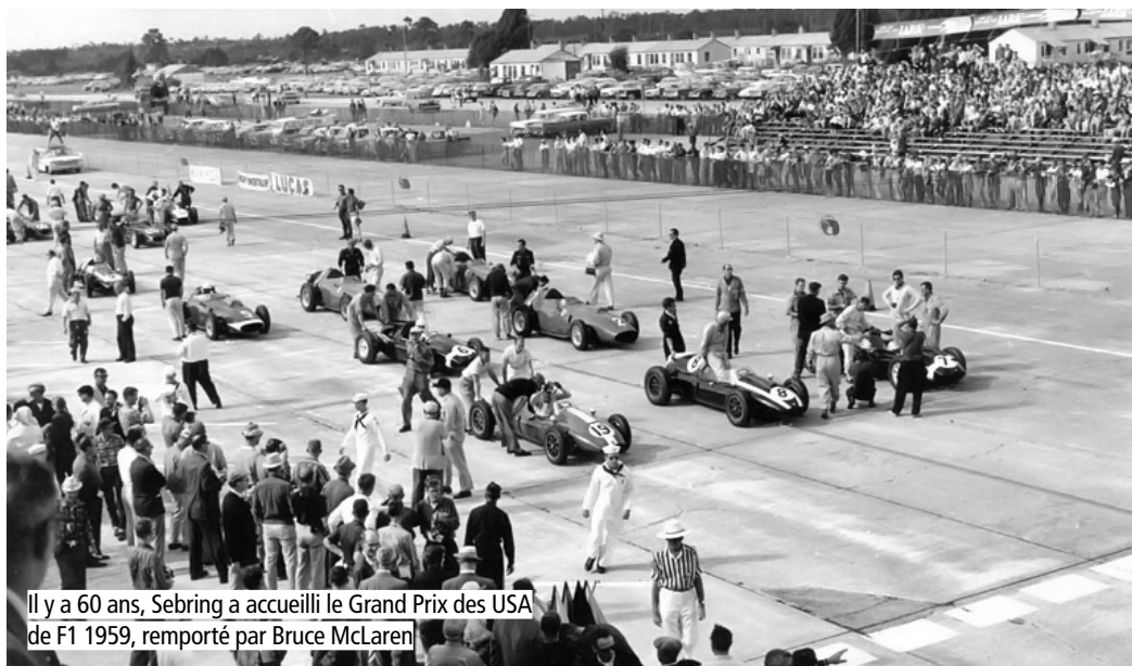
Il y a 60 ans, Sebring a accueilli le Grand Prix des USA de F1 1959, remporté par Bruce McLaren