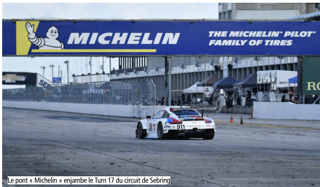
Le pont « Michelin » enjambe le Turn 17 du circuit de Sebring