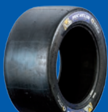
SLICK SOFT - MEDIUM - HARD