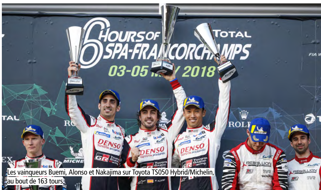
Les vainqueurs Buemi, Alonso et Nakajima sur Toyota TS050 Hybrid/Michelin, au bout de 163 tours.