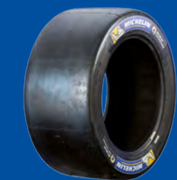
SLICK SOFT - MEDIUM - HARD