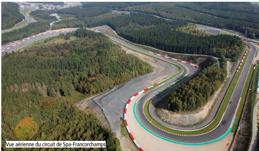
Vue aérienne du circuit de Spa-Francorchamps