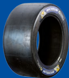
SLICK MEDIUM - HARD