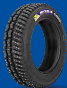
X-ICE NORTH 3