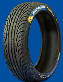
FW3 (FULL WET)

Dimensions : 20/65-18 Conditions humides, froides, givre et verglas.