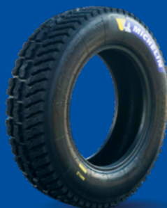
X-ICE NORTH 3