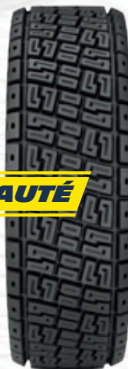
LATITUDE CROSS PZ

RECOMMANDÉ POUR LES PISTES ROULANTES ET LES PAYS NORDIQUES