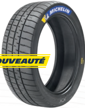
PILOT SPORT FW3