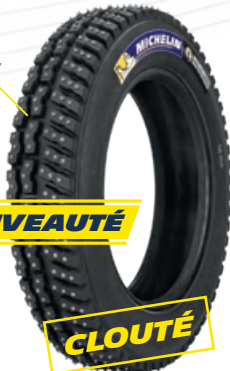
PILOT ALPIN NA01