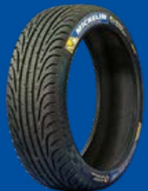
FW3 (FULL WET)

Dimensions : 20/65-18 Conditions humides, froides, givre et verglas.