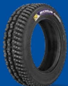
X-ICE NORTH 3