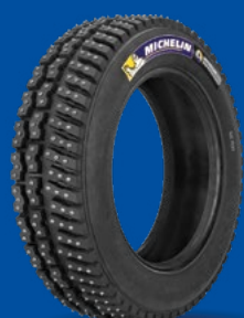
X-ICE NORTH 3