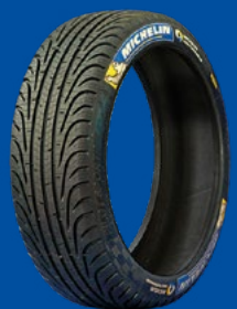
FW3 (FULL WET)

Dimensions : 20/65-18 Conditions humides, froides, givre et verglas.