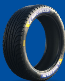
FW3 (FULL WET)

Dimensions : 20/65-18 Conditions humides, froides, givre et verglas.