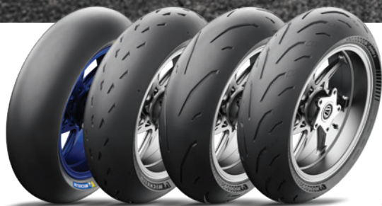
De gauche à droite, MICHELIN Power MotoGP™, MICHELIN Power Cup², MICHELIN Power GP², MICHELIN Power 6